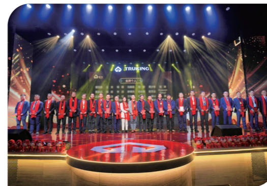
楚天科技年终颁奖