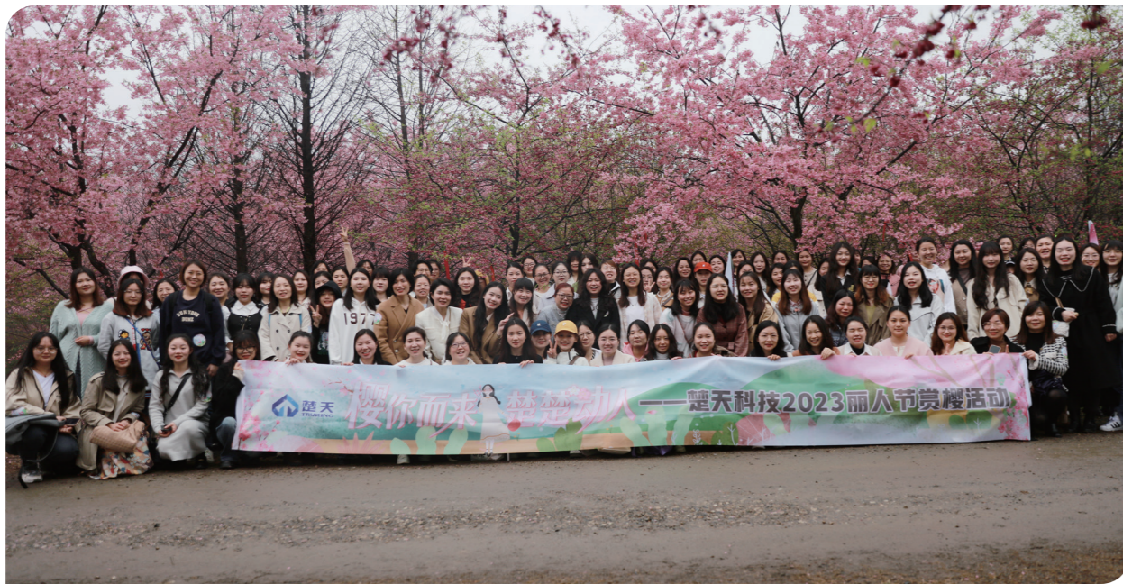
楚天科技丽人节赏樱活动