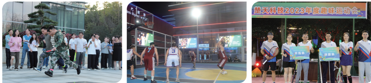
楚天科技趣味运动会

企业文化创新离不开精神文明建设，楚天科技运用多种载体，不断创新文娱方式，为员工营造良好的生活、工作平台。楚天科技园区按照厂区、景区、社区三区融合的理念建设，让员工“吃得好、住得好、干得好、收入好”。在风景如画的楚天园区，多栋员工公寓里电视、空调、洗衣机等一应俱全，让员工毫无后顾之忧，在舒适优美的环境中工作、生活。楚天科技依托工会羽毛球、舞蹈、悦跑等十大协会，开展丰富多彩的活动，每年举办小年夜颁奖晚会、元宵喜乐会、三八丽人节、七一党建、八一建军、趣味运动会等活动，增强了楚天人的战斗力、凝聚力、向心力。