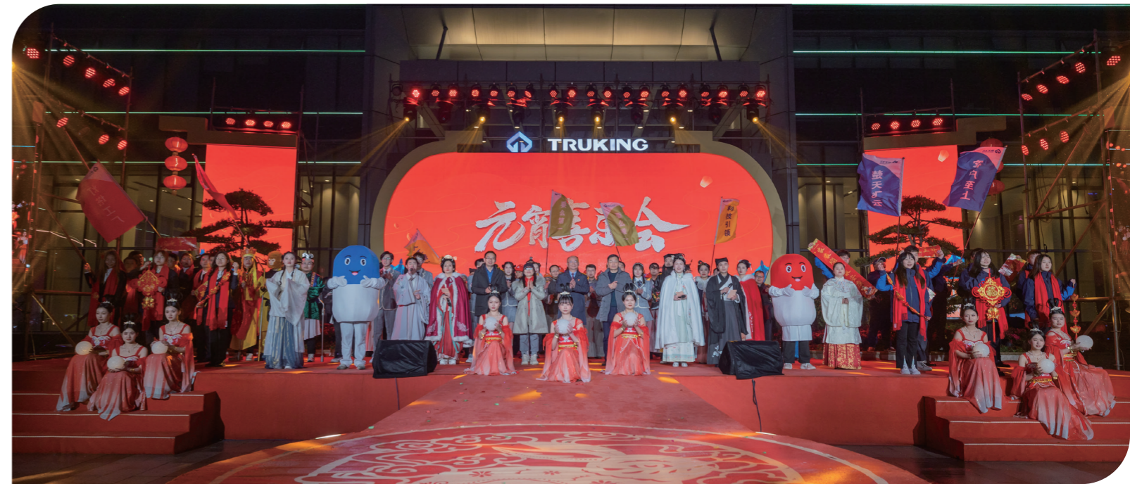
楚天科技元宵喜乐会