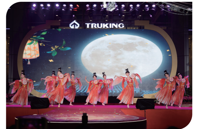
楚天科技元宵喜乐会