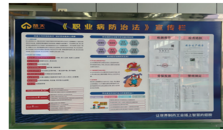
楚天科技“职业病防治法”宣传看板

2023年，楚天科技EHS委员会围绕“人人讲安全，个个会应急”安全生产月主题，开展了一系列的活动宣传，通过专题宣传栏、知识培训、早会评比、实操比武、应急演练、标兵评选以及应知应会以考促学等活动形式，以“启动仪式拉序幕，文化引领安全月”、“实际行动做贡献，安全标兵在身边”、“应知应会以考促学，安全知识加强巩固”、“安全生产无事故，行车操作我最强”、“多层次隐患排查，全方位专项整治”、“落实人人讲安全，炎炎夏日送清凉”、“安全生产百日无事故”等多项系列化安全生产活动，提高员工安全意识、促进企业安全文化建设。