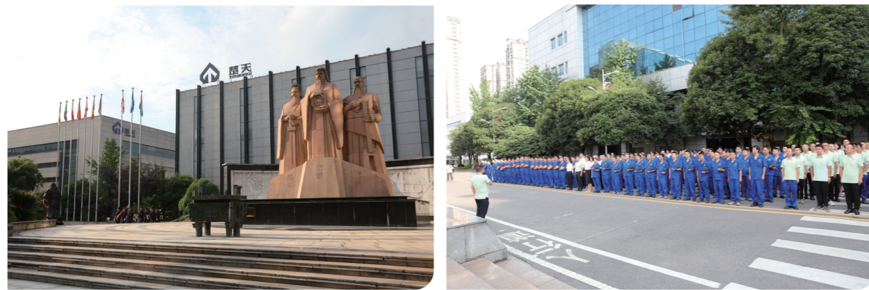
● 楚天科技举行升旗仪式、八一建军节座谈会