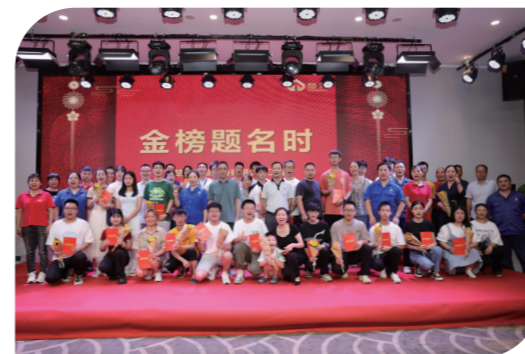
楚天科技“金榜题名时”