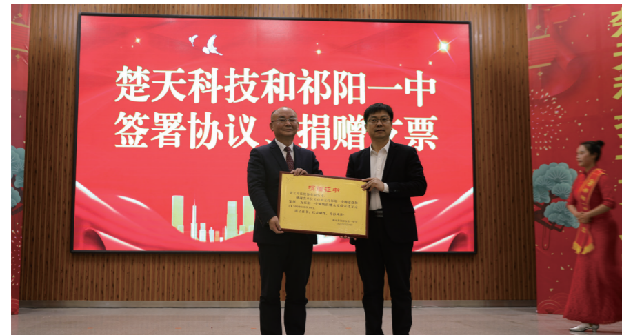
▲ 楚天科技向祁阳一中捐赠一千万