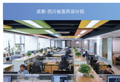
成都·四川省医药设计院