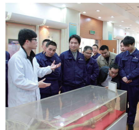
楚天科技组织吸烟员工赴长沙湘雅医学院人体科技馆进行科普教育

为保障员工的身体健康，楚天科技建立了职业健康制度管理体系，逐级落实职业健康安全措施，定期组织员工健康体检，并建立员工健康档案，进行年度职业危害因素检测，并根据相关数据不断进行现场优化改善，如增加除尘与隔离设备等，为职工提供安全舒适的作业条件和防护设备，持续做好员工职业健康管理工作。