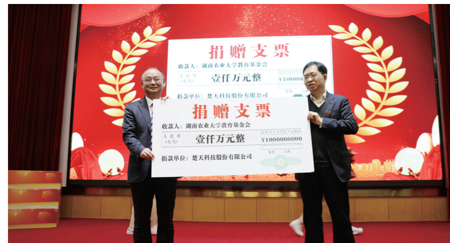
▲ 楚天科技向湖南农业大学捐赠一千万