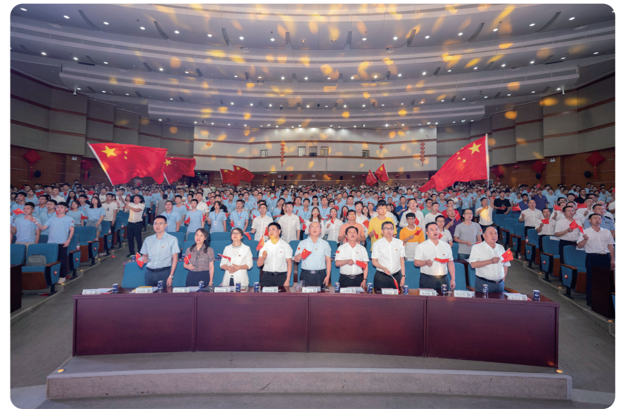
● 楚天科技组织各支部观影《大国建造1》、《大国建造2》，加强爱国主义教育