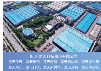
长沙·楚天科技股份有限公司 楚天飞云、楚天源创、楚天微球、楚天思优特、楚天思为康、楚天净邦、楚天科仪、楚天新材料、楚天派特、楚天博源等