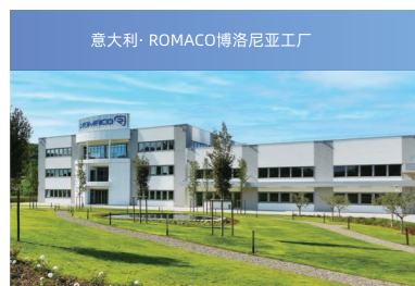
意大利·ROMACO博洛尼亚工厂