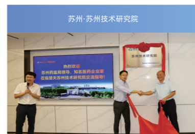
苏州·苏州技术研究院