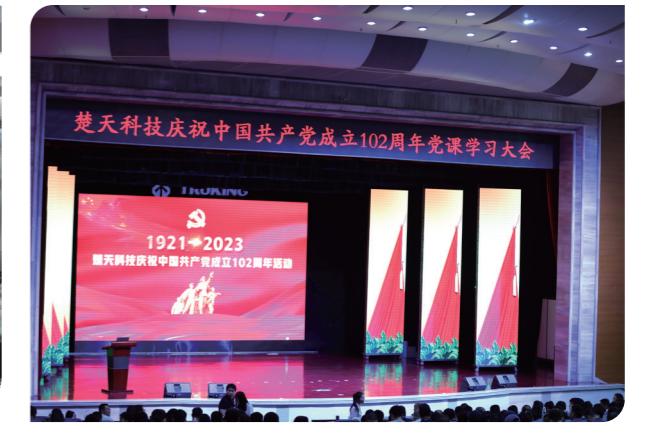
● 楚天科技庆祝中国共产党成立102周年党课学习大会